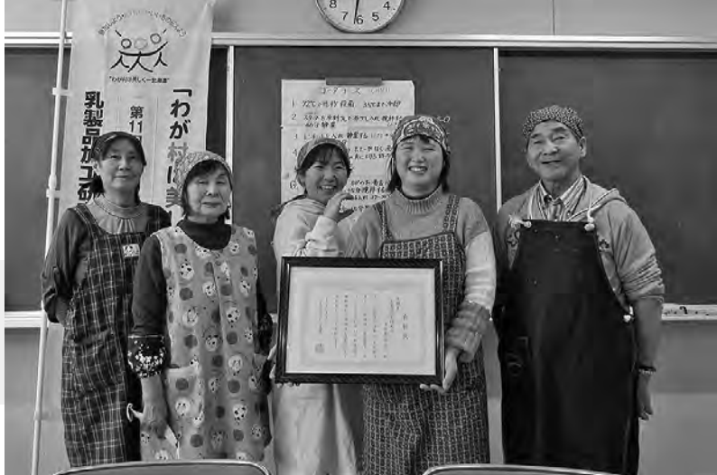
天塩合同庁舎の生活実習室で行われたチーズ作り