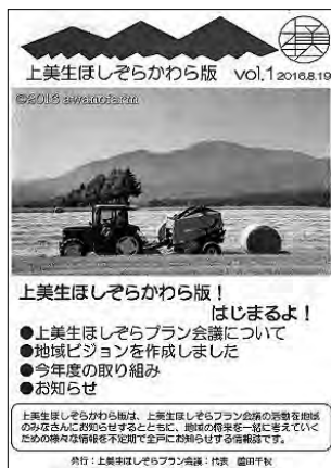
ほしぞらプラン会議が発行する広報誌