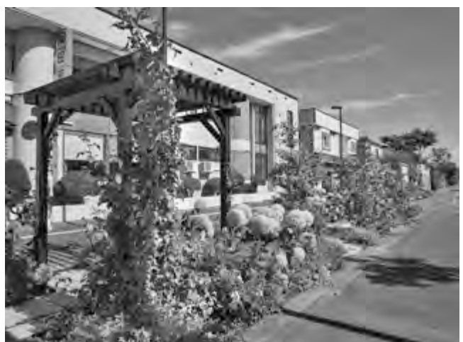
まちなか会場の一つ「花さんぽストリート」

まちなか会場の一つ「花さんぽストリート」では、地元の商店会が「第26回緑の環境デザイン賞」を受賞。各店が創意工夫を凝らして庭づくりを行い、訪れる人たちの目を楽しませます。