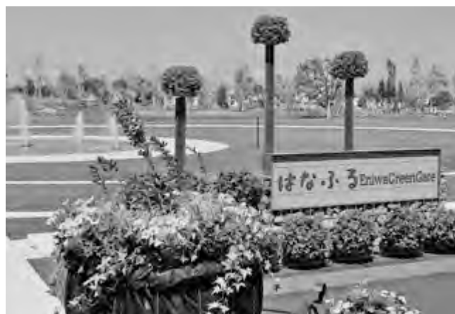
花の拠点「はなふる」

第39回全国都市緑化北海道フェアは、愛称「ガーデンフェスタ北海道2022」として、メイン会場のほか、道内各地の協賛会場及びスポット会場で構成しており、それぞれの会場が、美しい花であふれるガーデンや街並みで来場者をおもてなしして、北海道全体でガーデンフェスタを盛り上げます。