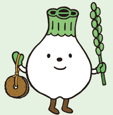
ウポポイPRキャラクター トウレットポん