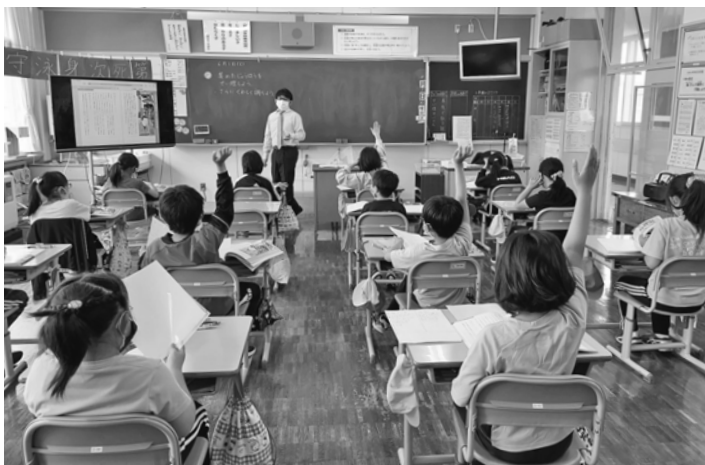
『北海道ふくしま歴史物語』を使って行われた福島小学校での総合学習の様子