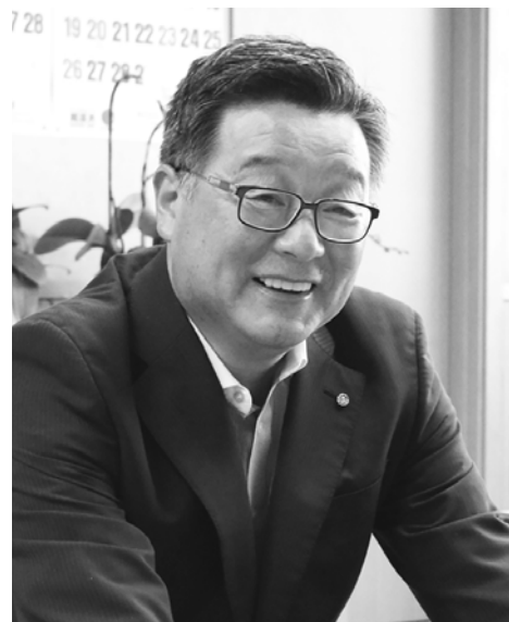
「民間の皆さんがまちの資源を一生懸命に磨いてくれて光を放ち始めた」と話す鳴海町長

「町内には、私たち先祖の生きざまの足跡が残っています。それを町民が大切にすることは、まちの誇りにもつながっていく。代々子どもたちに伝えていくことで脈々と続いていくものになります。子どもたちには、まちの文化や歴史を担っていくのは自分たちだということにも気が付いてほしい」と、鳴海町長は子どもたちへ託す