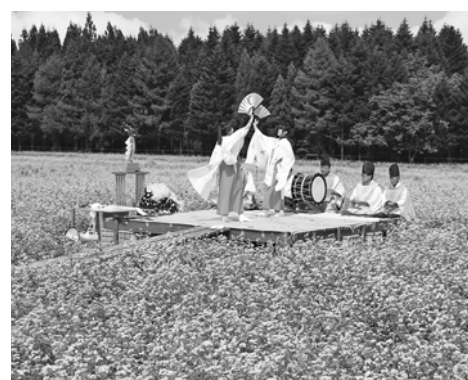
白いそばの花の中で松前神楽の「八乙女舞」などが披露される「千軒そばの花観賞会」

殿様街道探訪ウォークとともに、地域の文化資源を活かした新しいコンテンツが生まれたといえます。