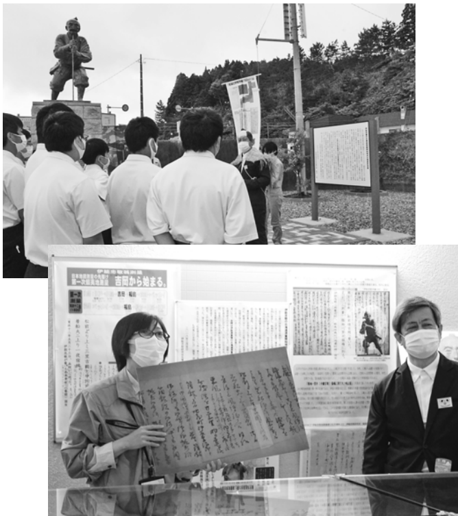
伊能忠敬北海道測量開始記念公園などを訪れた松前町の中学生に解説する中塚会長と鈴木学芸員。町外からも授業の一環で講師派遣依頼があれば対応している

行政、住民、民の団体や企業など、さまざまな立場の人たちが連携して、まちの文化資源を手づくりで守り伝え、新たな資源を発掘することを実践してきた福島町。足もとの文化資源を活かしながら、手づくりでまちの誇りを次世代に伝えていく真剣な活動が、まちの魅力につながっているようです。人口減少時代に小さなまちが生き抜いていくためには、みんなで次世代につながる夢と可能性を伝承していくことが大切です。福島町の挑戦は、その先駆的な取り組みの一つといえるでしょう。