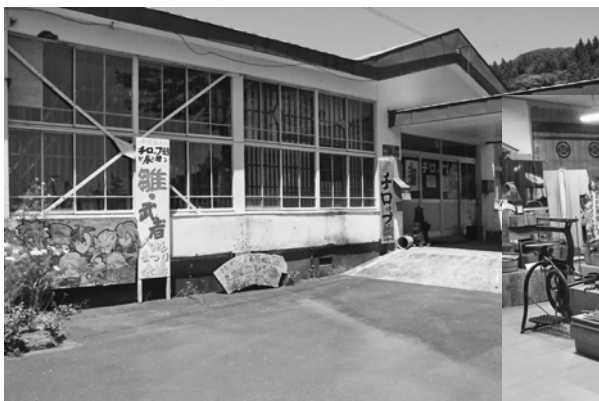
教育委員会と町民が連携して運営されているチロップ館

福島町には郷土資料館や博物館は建設されていませんが、官民が連携して運営している「チロップ館」※4があります。