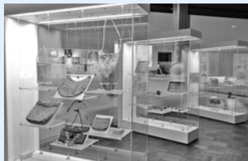
博物館 展示室風景