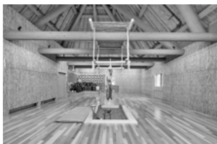
伝統的コタン チセ (内観)