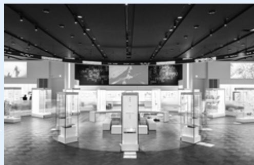
博物館 基本展示室 (全体)