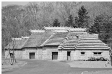
伝統的コタン チセ (外観)