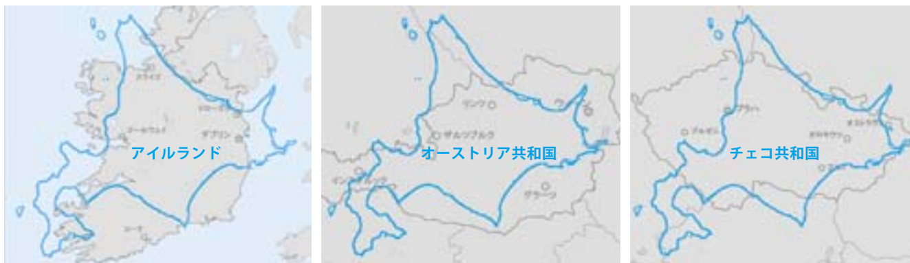
図2 北海道と欧州を重ねたイメージ