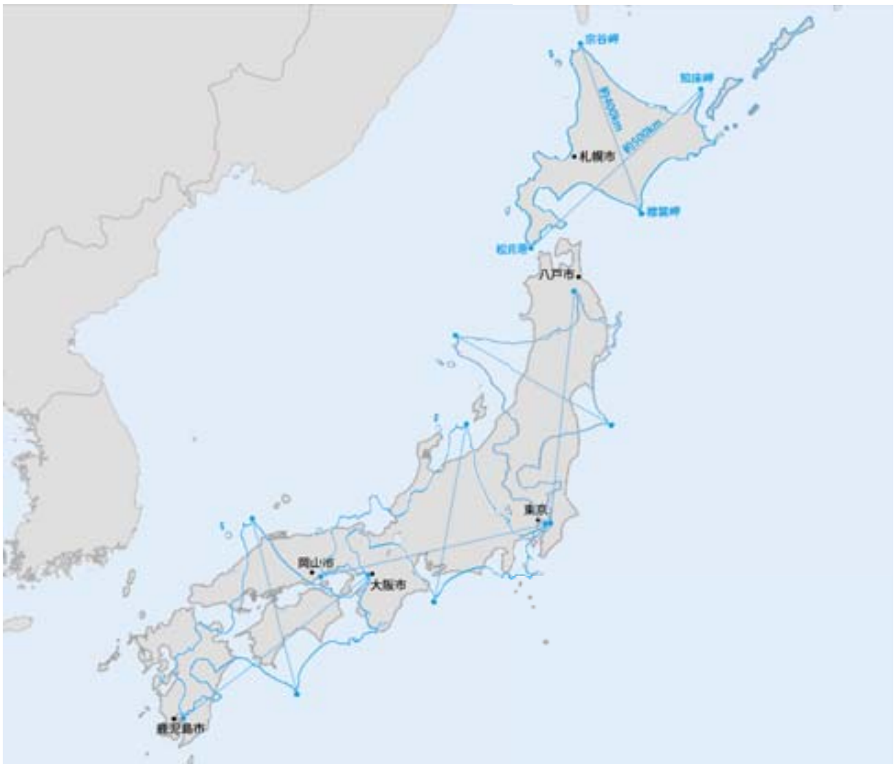
図1 日本と北海道を重ねたイメージ

※ 北海道の面積は総務省統計局日本統計年鑑による。 ※ オーストリア以下3カ国の面積は総務省統計局世界の統計2015「国連人口統計年鑑2013」による。