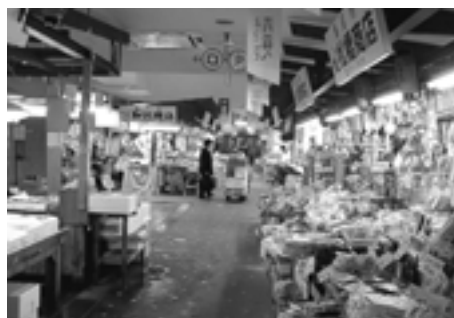
青森駅前に展開する複合施設「アウガ」、地下一階が生鮮市場

また、中心市街地活性化の一環として、街なか暮らしを促進してきましたが、高齢者のケア付きマンションの建設などが進み、中心部に一定の人口増が見られるなどかなりの効果がありました。最近では、新幹線の開業に合わせて、まちの魅力を向上させるため、ねぶたの保存・伝承・発信などを目的とした文化観光交流施設「ねぶたの家ワ・ラッセ」や地場産品加工工房・市場「Aファクトリー」などウォーターフロント開発が進んでいて、大きな効果を産んでいます。