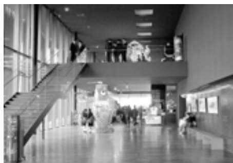
ねぶたの家「ワ・ラッセ」