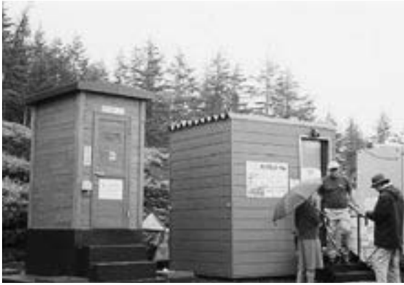
富士山須走口5合目での実証実験(中央が正和電工のバイオトイレ)