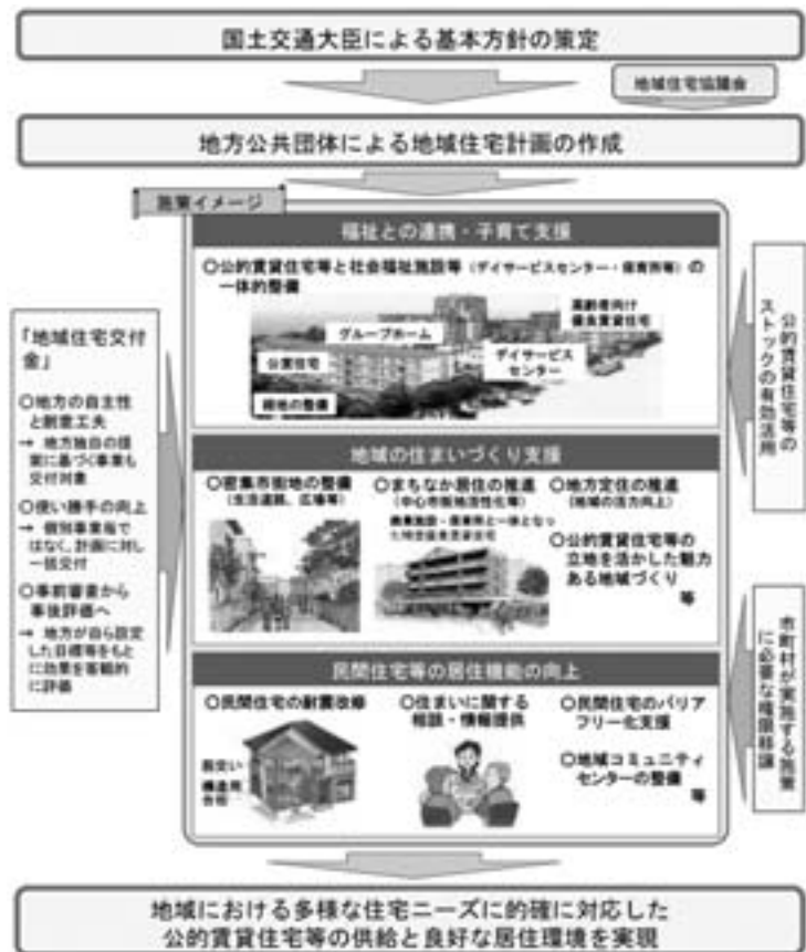
「地域における多様な需要に応じた公的賃貸住宅等の整備等に関する特別措置法案」イメージ

高齢者向け住宅の情報提供・相談体制の充実を図ること等により高齢者の住み替え支援を推進します。