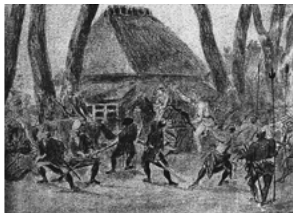
生麦事件図(英人ワーグマン画。横浜開港資料館蔵)