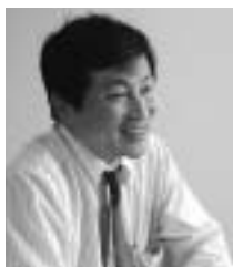
知床の世界遺産推薦を受けて、道東ではラムサール条約の湿地登録へ声を挙げる地域が見られるなど「自然環境保全への意識が高まる波及効果が見られる」と鳥居次長。

世界遺産に登録されれば、世界中から自然に対して関心の深い観光客がやってくる可能性が高く、彼らの目は地域に対して厳しい評価を突き付けることもあるでしょう。法的な規制より、むしろこちらの方が地域にとっては難しい課題となるかもしれません