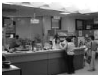
知床財団がある知床自然センターはエコツーリズムの拠点。案内窓口がありパンフレットも置かれている。

管理計画では管理の方策の一つとして「自然の適正な利用」を掲げ、観光などについては世界自然遺産としての価値を将来にわたって損なうことなく、適正に利用されるために、知床の原生的な自然にふ