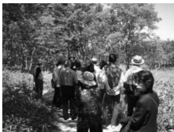
知床自然センター裏を出発、フレベの滝を見学できる散策コース。ガイド付きで歩く人も多い。